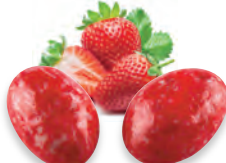
AMANDES FRAISE LAIT 924 678