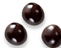
NOISETTES CHOCOLAT noisette caramélisée chocolat 924 236