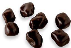
CUBES ORANGE CHOCOLAT écorce d'orange confite 924 142