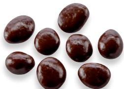
RAISINS AU SAUTERNES chocolat 924 177