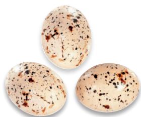
OEUFS DE MOUETTE CARAMEL ganache au caramel à la fleur de sel de Guérande 924 116