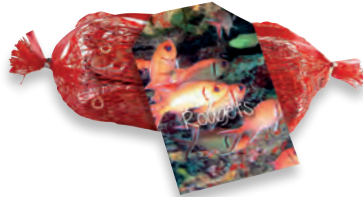
FILET 8 ROUGETS 910 037