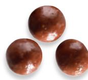
NOISETTES ENROBÉES chocolat lait et maïs 924 660