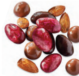
LES GOURMANDISES amandes et noisettes 924 032