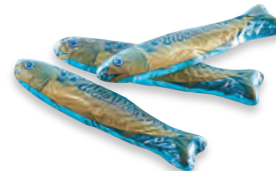
MAQUEREAU chocolat 910 086