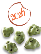
SAVEUR PISTACHE riz soufflé chocolat blanc 924 687