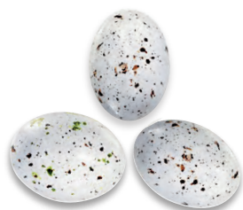
OEUFS DE MOUETTE praliné 924 055