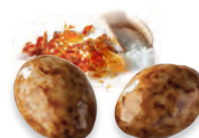
AMANDES CAMEL D'ISIGNY ET FLEUR DE SEL DE GUÉRENDE 924 165