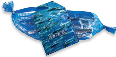
FILET 8 SARDINES 910 028