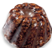
CANNELÉ gianduja crêpe dentelle de Bretagne 924 122