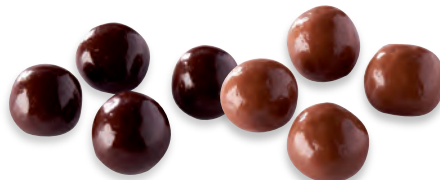
DOUCEUR SUCRÉE SALÉE biscuit croustillant, avec une pointe de sel, enrobé de chocolat chocolat noir 924 608 chocolat lait 924 607