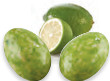
AMANDES CITRON VERT LAIT 924 677