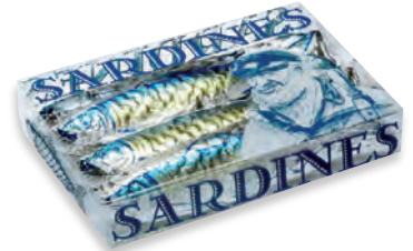
BOÎTE 6 SARDINES 910 052