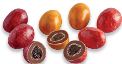
BILLES INTÉRIEUR PÂTE DE FRUITS fraise - framboise - pêche 924 173