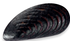
MOULES DRAGÉIFIÉES praliné crêpe dentelle à la fleur de sel de Guérande 924 121