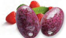
AMANDES LAIT AUX FRAMBOISES 924 624