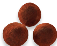
NOISETTES noisette caramélisée cacaotée 924 861