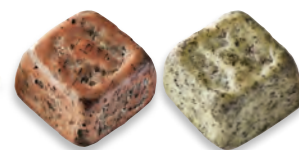
PAVÉ GRANIT DRAGÉIFIÉ Cris : praliné noisettes, crêpe dentelle de Bretagne 924 160 Rose : praliné noisettes, crêpe dentelle de Bretagne 924 094