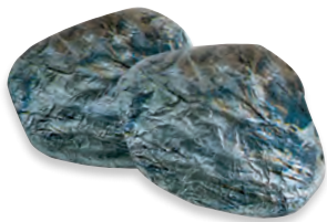
1/2 HUITRES LAIT praliné noisettes 910 066