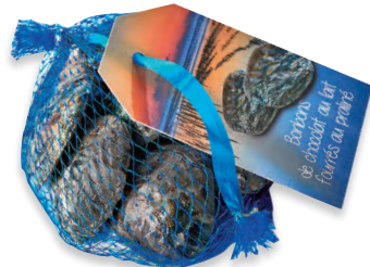
FILET 1/2 HUITRES LAIT (par 20) filet 100 g 910 065