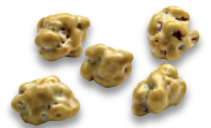
L'ORIGINAL riz soufflé chocolat blanc 924 021