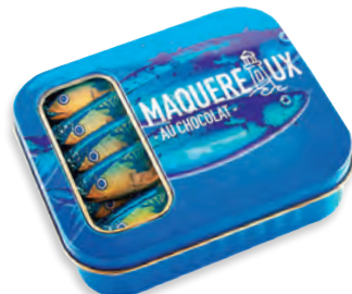
BOÎTE 12 MAQUEREAUX CHOCOLAT (par 24) - 120 g 910 227