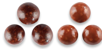
BILLES CEREALES ENROBEES CHOCOLAT au cœur croustillant chocolat noir 924 527 chocolat lait 924 526