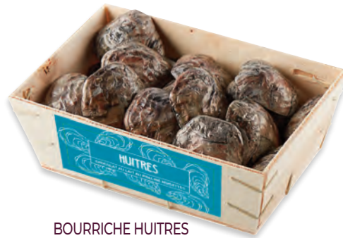
BOURRICHE HUITRES LAIT sous alu 910 071