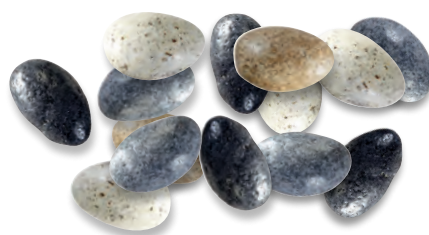
GALETS ASSORTIS amandes 924 092