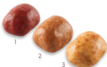
POMMES DE TERRE 1 - praliné et crêpe dentelle de Bretagne 924 073 2 - du potager ganache à la fleur de sel saveur caramel 924 063 3 - praliné aux éclats d'amandes 924 029