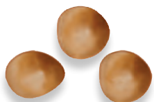
NOISETTES BLONDES noisette caramélisée 924 836