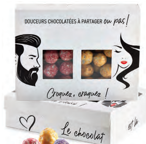
BOITES CHOCO GRANITÉS assortis 160 g - (par 18) céréales saveur framboise - ananas 3 motifs en assortis par carton 918 297