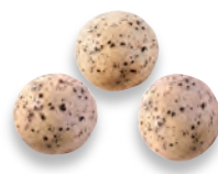
BILLES céréales saveur thé au jasmin 924872