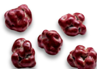
PIMENT D'ESPELETTE riz soufflé chocolat lait au piment d'Espelette 924 417