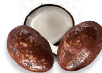
AMANDES LAIT NOIX COCO 924 642