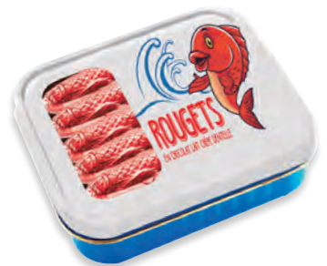
BOÎTE 12 ROUGETS lait crêpe dentelle fleur de sel de Guérande