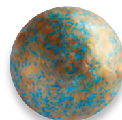
PERLE BLEUE Ganache caramel 924 640