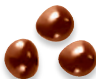
NOISETTES LAIT noisette caramélisée lait 924 205