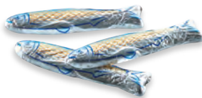
SARDINES chocolat lait 910 020