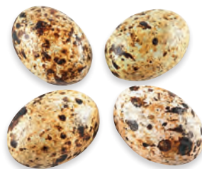
ŒUFS DE GOELAND gianduja et crêpe dentelle de Bretagne - env. 9 g. 924 045