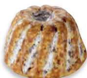
KOUGELHOPF gianduja crêpe dentelle de Bretagne 924 115