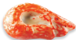
CREVETTES praliné crêpe dentelle à la fleur de sel de Guérande chocolat blanc 924 654