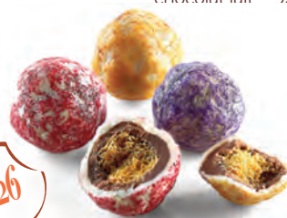
CHOCO GRANITÉS assortis céréales saveur framboise - ananas - myrtille 924 882