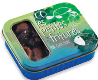
BOÎTE FRITURES ASSORTIES chocolat, chocolat lait (par 24) - 130 g 910 251