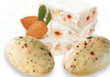
AMANDES AU NOUGAT 924 178