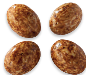
ŒUFS DE CORMORAN praliné noisettes - env. 10 g. 924 162