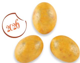
ŒUFS PARIS-BREST ganache Paris-Brest 925 003