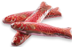
ROUGETS chocolat lait crêpe dentelle lait crêpe dentelle fleur de sel de Guérande 910 087