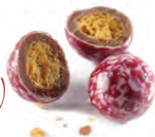
BILLES CÉRÉALES FRAMBOISE céréales saveur framboise 924 568