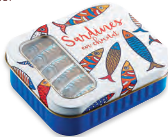
BOÎTE 12 SARDINES (par 24) - 120 g 910 225