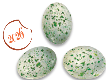
ŒUFS PISTACHE praliné pistache 924 002