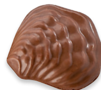
HUÎTRES ENTIÈRES LAIT praliné lait crêpe dentelle de Bretagne fleur de sel de Guérande 910 234