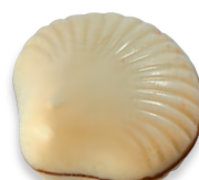
COQUES praliné ivarine crêpe dentelle de Bretagne fleur de sel de Guérande 910 235