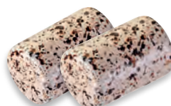
BOUCHON DRAGÉIFIÉ praliné noisettes crêpe dentelle de Bretagne 924 052